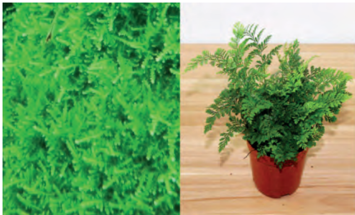
三角莫斯和狼尾蕨